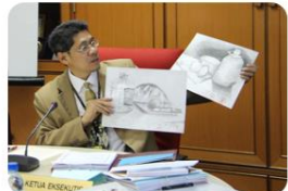
Majlis Peperiksaan Malaysia