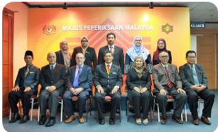
Jawatankuasa Pensijilan Majlis bersidang