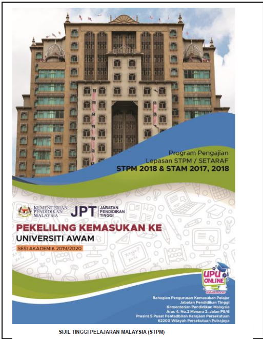
SIJIL TINGGI PELAJARAN MALAYSIA (STPM) Mendapat sekurang-kurangnya PNGK 2.00 dengan Gred C dalam 3 mata pelajaran termasuk Pengajian Am.